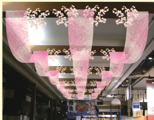
春の花を取り入れた演出例です。展開ポイントに数種の花を散りばめるだけでも、効果が大きく変わります。