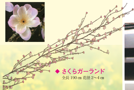
◆ さくらガーランド 全長 190 cm 花径 2~4 cm